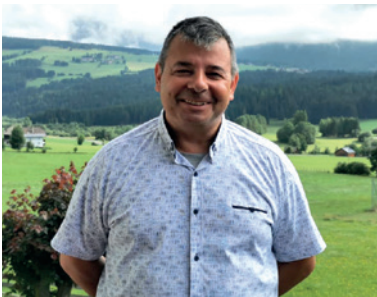
Vendel (sonka freut sich auf Ihren Besuch.

Winter-Abenteuer im sonnenreichsten Ort Österreichs! Das Haus ist ruhig gelegen - direkt an der Langlaufloipe und nur wenige Schritte vom Skibus zum Fanningberg entfernt. Der herrliche Ausblick auf die umliegenden Berge macht schon frühmorgens Lust auf den bevorstehenden Tag im Schnee. Mit einem Skipass haben Sie Zugang zu den Skigebieten Fanningberg, Großbeck-Speiereck und Katschberg (erweiterbar mit Obertauern).